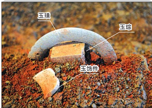
考古人员发掘出的玉璜、玉琮和一件不知名的玉串饰。

那么,沂水崮顶春秋墓主棺室有没有可能没下葬墓主?考古专家说,不排除这种可能性。在古代,若军事主管在外面战死,尸骸运不回来,也有为其建设一座衣冠冢的做法。当然,也有另外一种可能性,经过2500多年的岁月,墓主人的遗骸