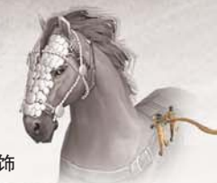
战马头部有精美配饰

始建于1997年,2003年扩建,破坏了古墓北侧车马坑。专家估计车马坑为10辆战车,由于近年施工破坏现只残存4辆,其中2号车上还载有鼎、鬲、敦共3件实用器。