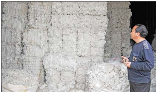
4月20日,作坊老板介绍,他们都是用这种棉花加工再生棉。