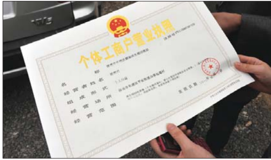
4月20日,执法人员到作坊检查,一家作坊当天刚刚办理完营业执照。