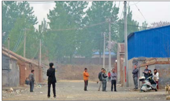
4月20日,执法人员到作坊检查,业户们都停了工,关紧了大门。