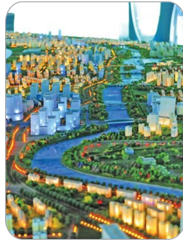
▲小清河模型十分精致。

除主河道及上游的垃圾外,支流河口的垃圾最让人头痛。姚女士坦言,虽然拦了截污带,但保洁船一半以上的工作量都是清理这些地方垃圾,否则一遇大雨,这些