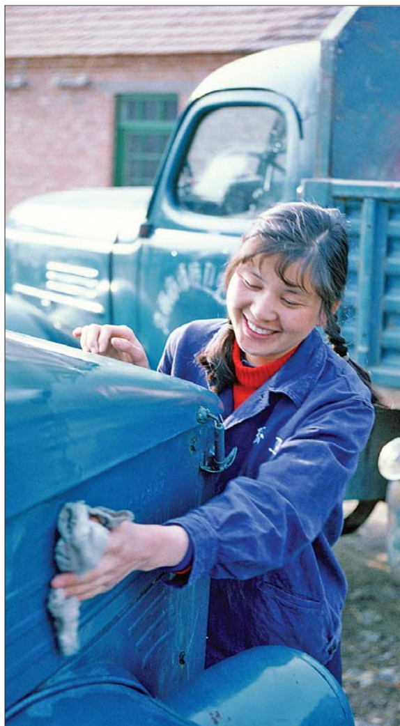
“铁姑娘”于风琴在擦垃圾车。

此次环卫老古董征集活动截止到6月15日。如果您家里有环卫老古董的话,希望您能把这些环卫老物件、老照片拿出来晒一晒。此次活动联系部门为历下区城管局组织人事科,地点位于经十路11353号(山东省博物馆东500米)。联系人:张科长,联系电话:86400942。