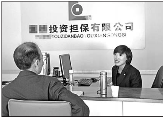
非融资性担保公司生意挺火。

“一万元理财,全年利息12%,你有兴趣可以去公司咨询。”近日,在济宁城区农贸市场等流动人口较多的场所,总会看到有人在向过路市民发放关于投资担保公司的宣传单页。记者调查了解到,一方面许多市民有着理财的渴望,另一方面很多中小企业急需周转资金,作为融资中介机构的担保公司为抢占更多的民间资本蛋糕,开始从室内走出来,主动宣传自己。