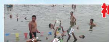
神奇的东方不沉湖