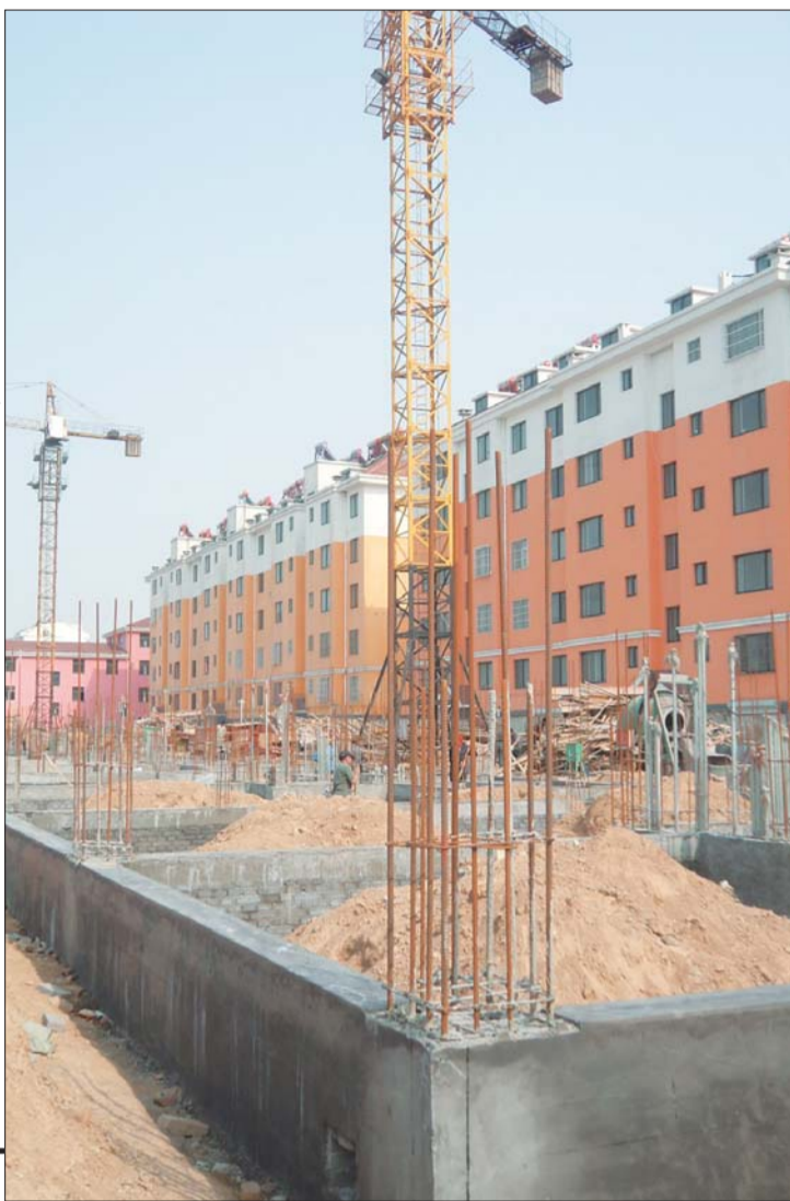
新庄居委会居民安置楼院内其中一处违规建设的楼房。

“城中村改造的房子如果上报立项审批后,政府会给予一定的资金以及政策支持,但是基本的审批手续还是要有,如图纸审查,质量监督,安全监督,招投标等,否则会工程质量安全带来重大的隐患。”监察大队工作人员告诉记者,如果该项目相关建设单位依然对建设部门的通知置若罔闻,建设局将对参建各方主体进行行政处罚。