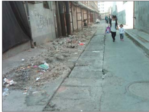
从下水道清出的淤泥。