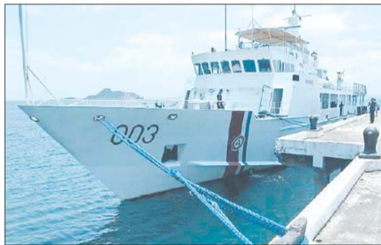
“邦板牙”号搜救船 资料片

刘为民表示,中国政府将继续坚定地维护国家领土主权。中方要求菲方严肃、认真对待中方关切,切实尊重中国领土主权,不要再采取任何使事态扩大化、复杂化的行动,恢复黄岩岛海域的和平与安宁,使中国渔民的正常生产不受干扰。