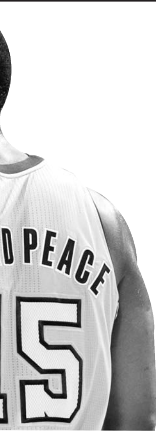
▲从“阿泰斯特”到“慈世平”,他满脑子的怪念头和发型一样变化不定。

此外“世界和平”在场,还赋予了湖人一种铁血精神。尽管暴力是球场上所不允许的,但“血性”却是篮球不可缺少的,“世界和平”恰恰能带给湖人这种气质。