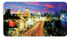
苏沪杭+乌镇三日游 成人 380元/人(29号发)