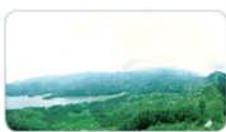
蒙阴蒙山一日游 成人 148元/人(29、1号发)