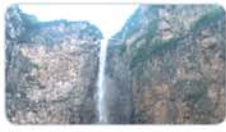
云台山二日游 成人 370元/人(29、30号发)