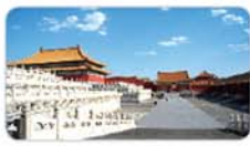
北京汽车五日游 成人 598元/人(28号发)