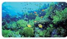
青岛海底世界+崂山品质三日游 成人 458元/人(29号发)