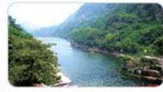
太行大峡谷二日游 成人 268元/人(29、30号发)