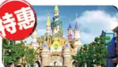
方特欢乐世界一日游 成人 220元/人(29、30、1号发)