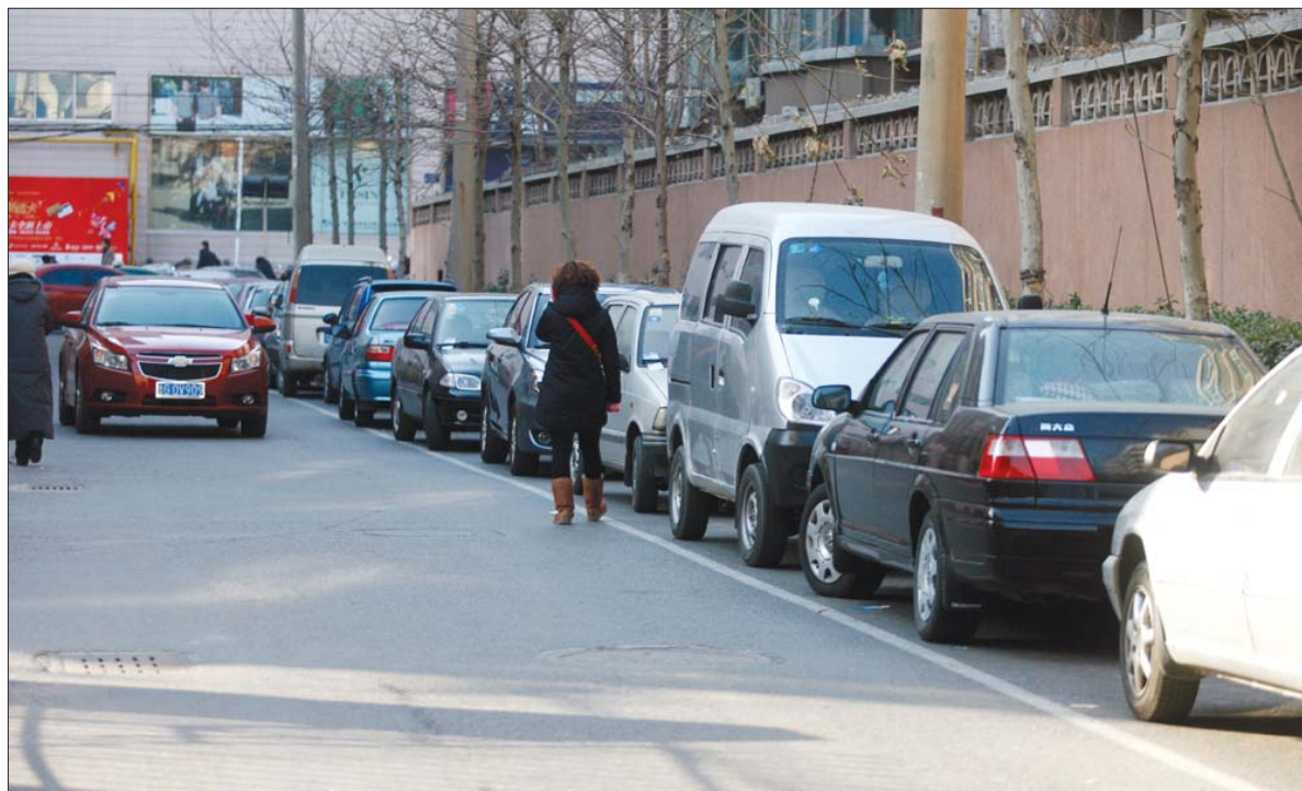
随着车辆的增加,在市区寻找一个停车位已不是一件容易的事。

根据对潍坊实际情况的分析,在《城市综合交通规划》中专家建议规划55个停车场,12100个泊车位。其中,潍城区规划社会公共停车场22个,泊位5500个;奎文区规划停车场25个,泊位4800个;高新区和坊子区规划停车场8个,停车场泊位数1800个。