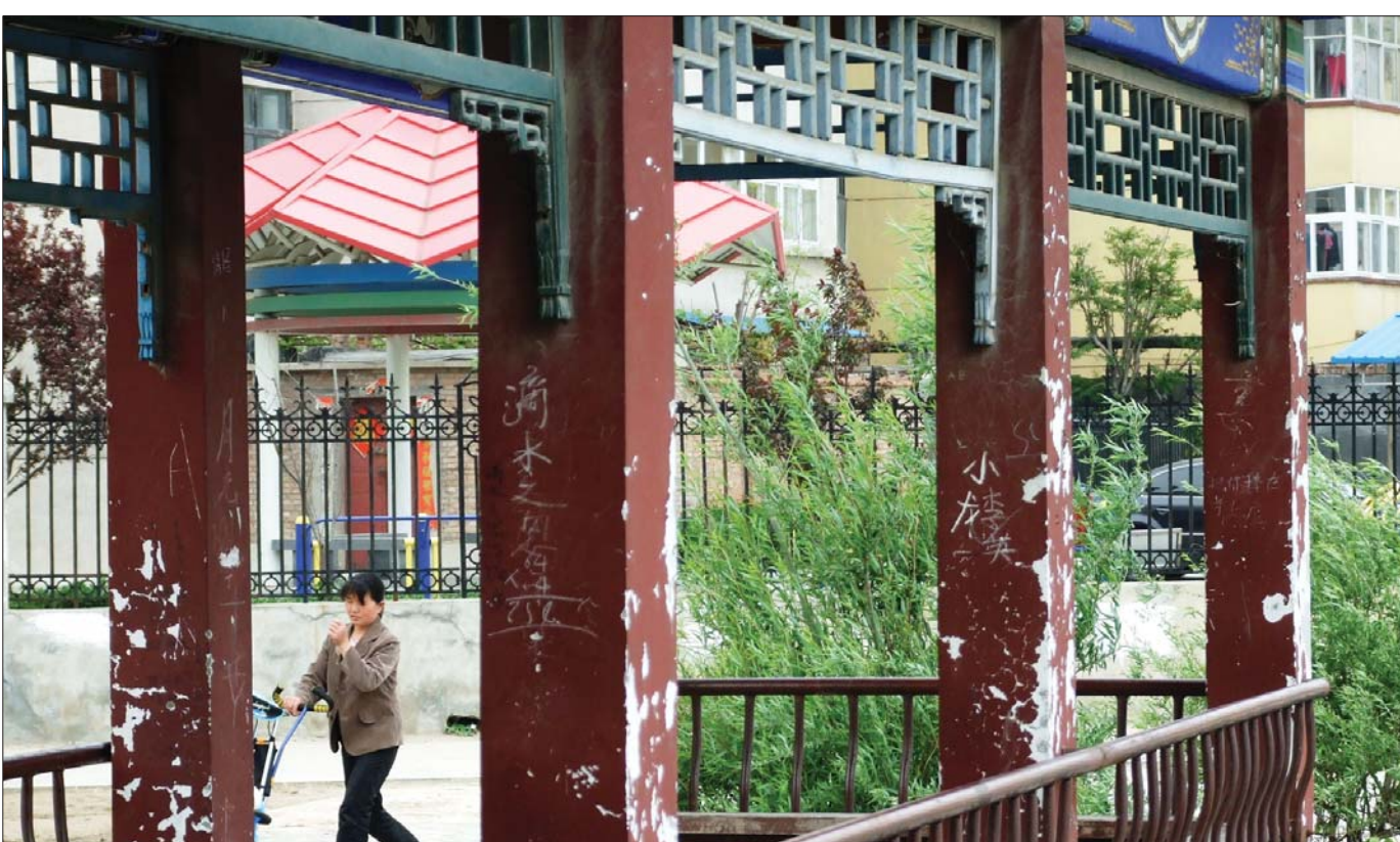
凤凰台附近仿古回廊廊柱被刻画成了大花脸。

地点:东昌宾馆面对东昌湖边 记者:李璇 时间:25日上午10:30 调查:东昌宾馆面对东昌湖边的一处金属