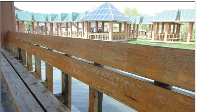
水城广场南侧紧挨湖边的一处回廊上的长椅被刻画得到处是细纹。

地点:兴华路附近运河四期小广场 记者:谢晓丽 时间:26日10:30 调查:在兴华路附近,贵华苑小区的西侧,运河广场上,矗立着一面景观墙,墙中间有三个拱形的门。墙上还比较干净,但拱形门内侧却被乱刻乱画。上面被人用绿色的粉笔写上了“江北水城,执子之手,思乡,爱我……” 地点:光岳楼 记者:杨淑君 时间:26日上午10:00 调查:光岳楼二层的城墙上,有不少小刀刻过的痕迹。记者数了数这样的痕迹有七八处。走进光岳楼里面,看着刻的痕迹更让人心疼。二层三层的柱子上,几乎每一个上面都刻着字,仔细数来,至少上百处,有一个柱子旁边明明放着“请勿刻画,爱护文物”的牌子,可是柱子上仍然刻满了名字。光岳楼外面