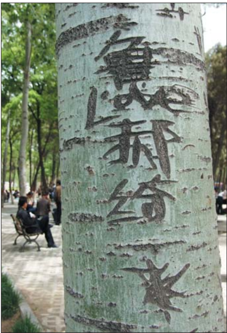
人民公园的一棵白杨树树干上被刻上了人名。

调查:在东昌湖西北角,一棵梧桐树长得十分粗壮,挺漂亮的树身却出现几块黑字,仔细一看,只见歪歪扭扭写下了“泰山石敢当”等字。旁边相邻不远处的一棵树,身上则出现几道划痕,树皮也被人撕去一大块。