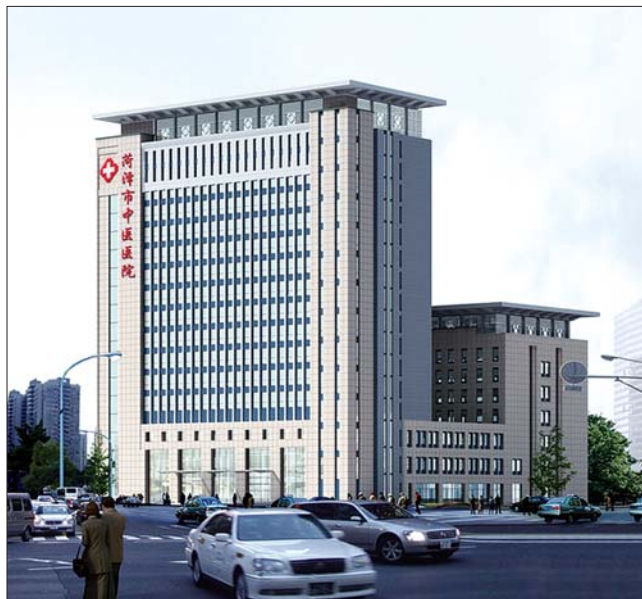
▲菏泽市中医医院一期综合大楼。

分娩镇痛是未来医学发展的需要和必然,随着医学模式的转变,“分娩必痛”的传统观念也得到了转变。医院本着科学化、人性化的服务理念,大力开展分娩镇痛工作,减轻产妇的痛苦,降低剖腹产率,同时也为产妇家庭减轻经济负担。