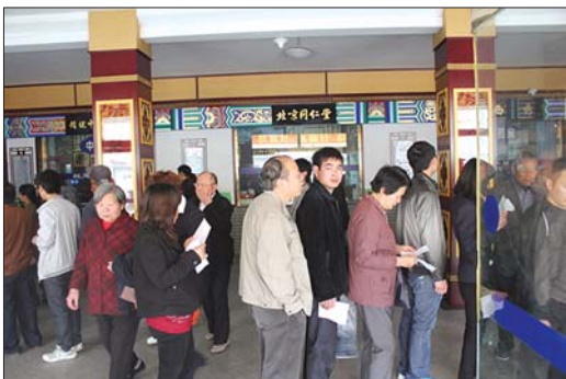
▲与北京同仁堂的联手协作后,药品质量明显提高,得到患者的好评。

医院的皮肤科和美容科率先引进了先进的治疗仪器,为给老百姓带来更好的治疗效果做出了实质性的努力。其中皮肤科率先引进了调Q激光治疗仪和311nm窄谱紫外线光疗仪(NB-UVB)。调Q激光治疗仪利用光爆破原理祛除病变组织里的色素,对痣、斑、纹身等具有显著的治疗效果。311nm窄谱紫外线光疗仪(NB-UVB)