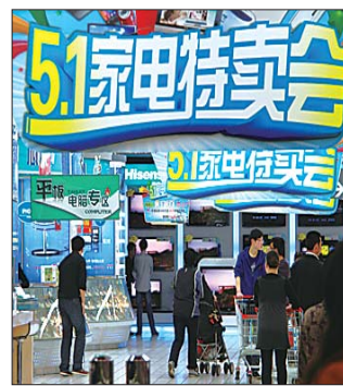
家电促销力度大。

凌云家电城开展“超强劲爆低价,千万豪礼相送”活动,活动时间为 4 月 27 日到 5 月 6 日。几乎各个品牌的家电都有一定的折扣,优惠幅度前所未有。