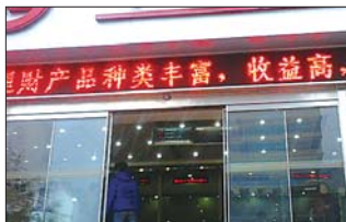
一银行 LED 屏上的宣传信息。

据工作人员介绍,“现在这些短期的意外保险,保障范围比较广,保障额度也非常高,而且保费也不高,外出旅行的市民,完全可以购买一份合适的保险,为自己的生命财产添加一份保障。”