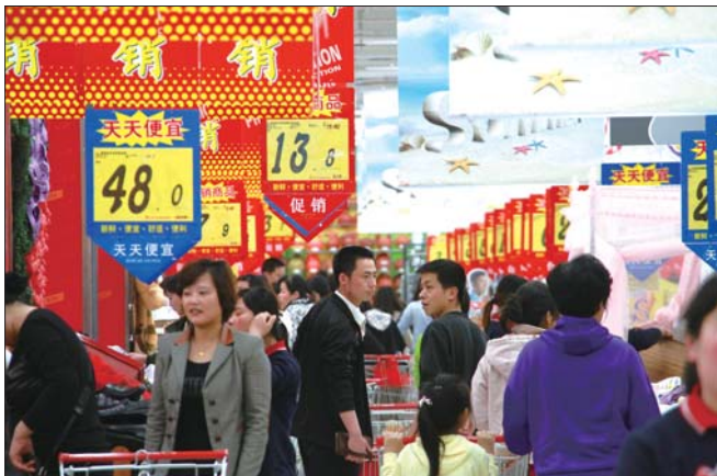
五一临近,日照市各大商场纷纷打出促销措施,抢占节日市场。

石臼苏宁电器摆放了四个家电品牌的宣传板,“一省到底,惠而浦热水器、法迪欧烟灶,全面促销中”、“伊莱克斯洗衣机+冰箱套购价 6599 元,另加赠 500 礼。”让人感觉促销味十足。走进卖场更是让人眼花缭乱,差不多每款家电都有促销。