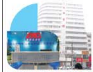
麦迪格(乌鲁木齐)眼视光中心