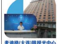
麦迪格(大连)眼视光中心