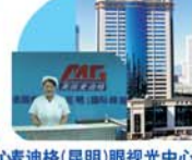
麦迪格(昆明)眼视光中心