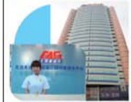
麦迪格(长春)眼视光中心