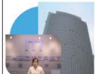
麦迪格(北京)眼视光中心