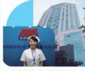
麦迪格(南宁)眼视光中心