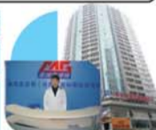
麦迪格(贵阳)眼视光中心