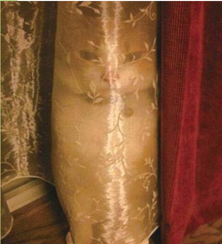
“一脸邪恶”的宠物们

摄影师Gleb Tarro在美国阿拉斯加卡特迈国家公园内捕捉到了这一惊险有趣的景象。三只灰熊站在布鲁克斯瀑布边上,伸长脖子捕食水里鲜活的大马哈鱼,终于可以饱餐一顿了。