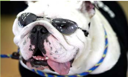
丑狗扮酷让人HOLD不住

据英国《每日邮报》消息,一只母鸭子竟然成了熟食店的忠实顾客了。据熟食店的店主称,近日一只孵化了12只小鸭子的母鸭子因不合群,才来到熟食店蹭饭,以前它还经常走进店里,后来就被训练得在外面等,直到店主出来喂它们。