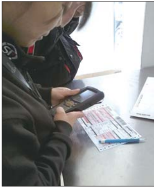
▲快递公司工作人员正使用“把枪”,扫描快件。

5月1日起,备受关注的《快递服务》国家标准正式实施,邮寄快件需要登记个人手机号、身份证、姓名和开箱验货等规定成为关注的热点。记者日前从淄博市各大快递公司了解到,这些公司对国家标准的实施都有所准备,但多数快递公司认为,大批量的货物由人工检查耗时耗力。市民则担心登记身份证会泄露个人信息。