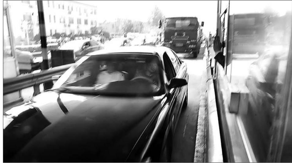
▲2日,符合免费条件的车辆顺利通过济南黄河大桥。

本报济南5月2日讯(记者 任志方 董从哲 实习生 赵岩) 2日是济南黄河大桥对济南市黄河以北区域七座以下车辆(含七座)的非营运小客车实行免费通行的首日。“今天从这里通过的车辆大概比平时多三分之一。”济南黄河大桥管理处相关负责人表示,此前大桥的日通车量在3万辆左右。