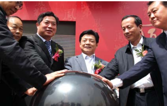
相关领导共同启动销售中心开门仪式

实施节能减排、科技提升的重要试点项目。项目总建筑面积约41.2万平米，位于济南东部新城的核心位置，紧邻第一主干道经十路，紧邻奥体中心、高新产业区，坐享雪山、山东建筑大学等优越的生态环境和人文环境。项目采用典雅隽永的新古典主义建筑风格，社区规划有36班9年制中小学，后期将引入知名中小学，为业主子女打造家门口的全程教育配套。目前项目是山东省首个通过国家住建部绿色建筑三星标识认证的绿色生态品质大盘，建成后将成为济南东部集品质居住、绿色居住、人文居住于一身的生态教育社区典范。目前，中建·凤栖第接待中心已正式对外开放，其86—126平米舒适两居、温馨三居即将公开认筹。