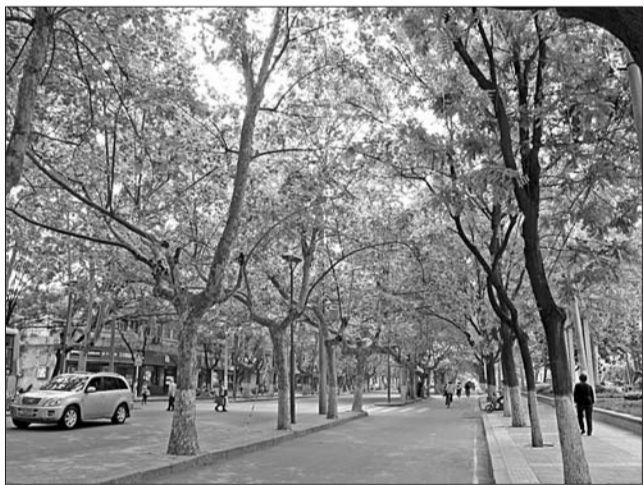
红星路上,绿树成荫。

步入五月,气温节节攀升,太阳也愈加毒辣。因为济宁城区很多道路近些年都经过了改造,一些道路上的大树被美丽的小树取代,但却少了树荫,中午时分,道路上炙热的高温让行人避之不及。而行走城区红星路、古槐路等道路上,大树播撒的绿荫让行人感觉十分惬意。