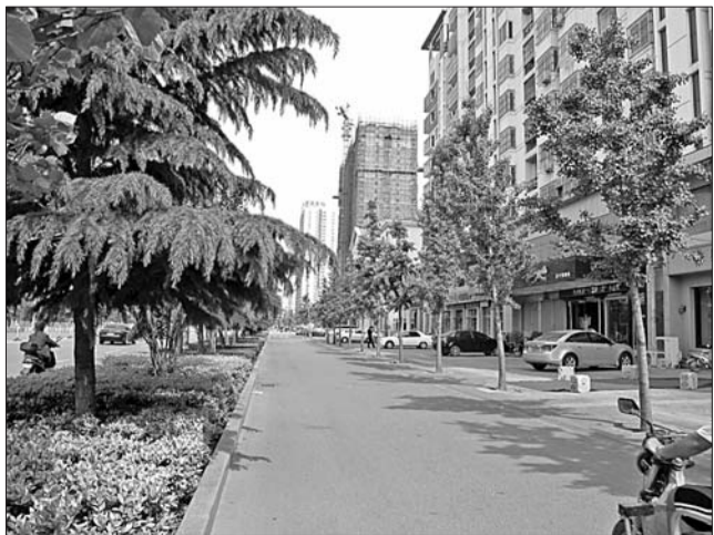
洸河路上,树荫很少。