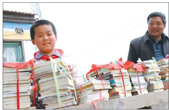
见到捐赠的大量图书,二郎庙小学的学生开心地笑了。