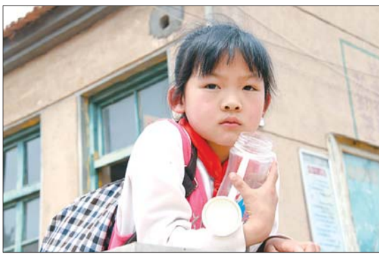
活动结束后,准备回家的二郎庙小学学生目送捐赠者离开。