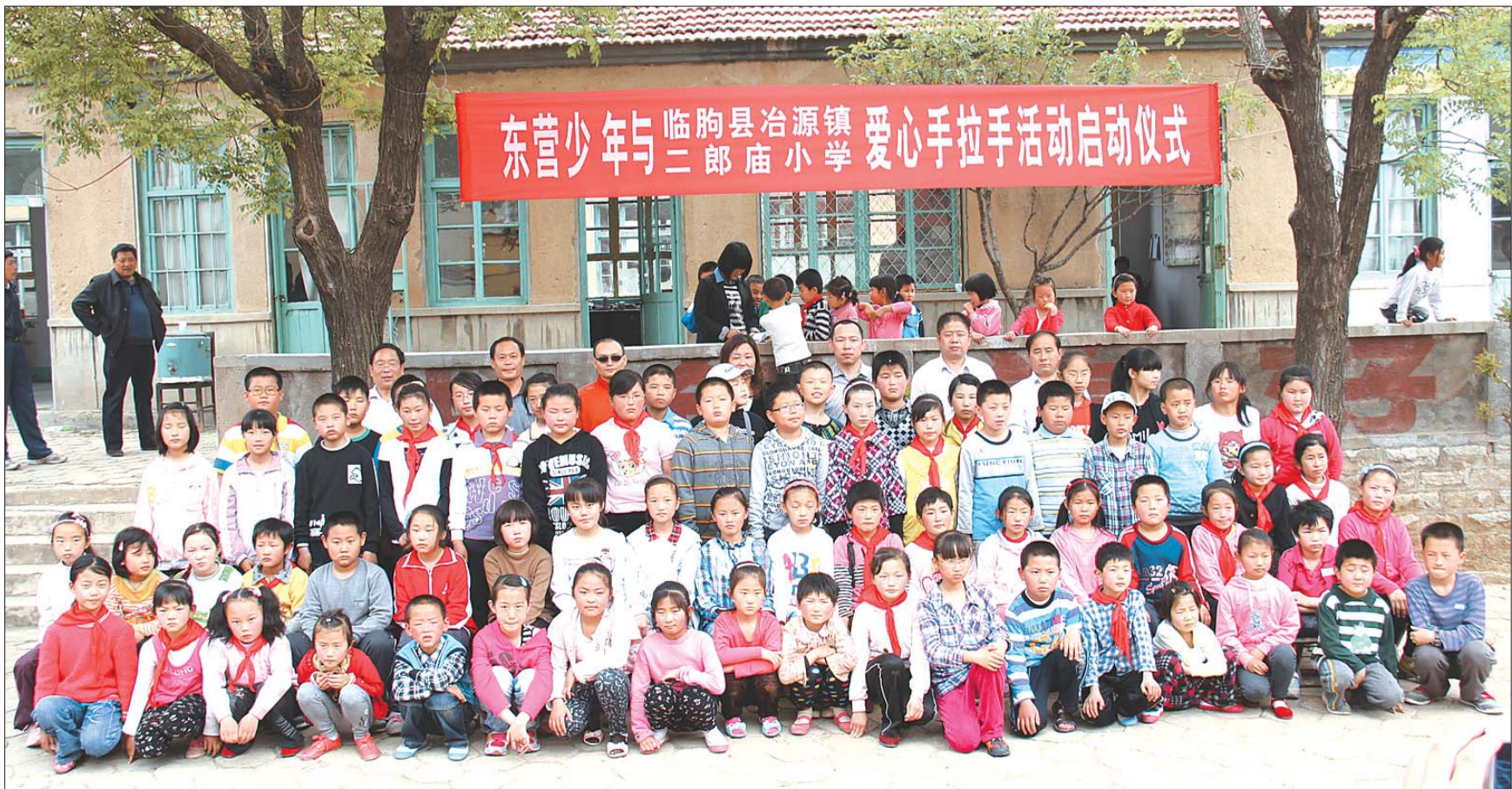
东营少年与二郎庙小学的学生合影留念。