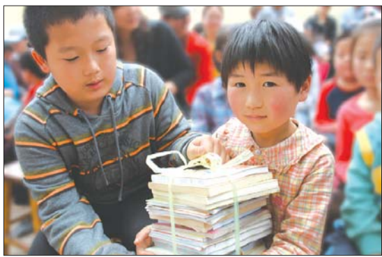
二郎庙小学的学生兴奋地接过新书。