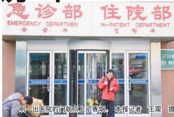
刚一出医院的门就点上了香烟。

标志。在旁的另一位记者提醒工作人员是否禁止吸烟,他们的反应有些尴尬。“站在你们的角度,我们应该禁止,可是站在人家的角度,我们得尊重不是?客人来了,我们一般尽量满足他们的要求。”一位工作人员称,他们担心直接制止客人,会影响酒店的生意。13时30分许,记者来到市区光明路上的两岸商厦。在商场一楼,记者未发现任何禁烟标志。记者随后点燃一根香烟在一楼走了一圈,经过商厦内的商铺和服务台,