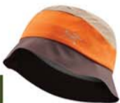
始祖鸟户外休闲帽550元