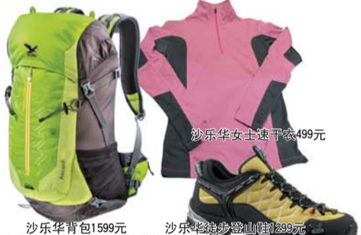
沙乐华女士速干衣499元