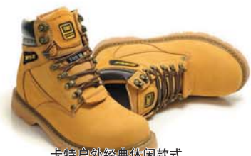
卡特户外经典休闲款式

源自美国加州的CATERPILLAR(卡特皮拉)是人类有史以来100个最受推崇、最受认可的品牌之一。一战期间美军标志性的“大兵靴”就是源自轮胎技术的CAT鞋。战争结束后,这款鞋马上风靡全球。改进后的CAT鞋一直保持着硬朗、优质、耐用的风格,耐磨防滑性能出众,防水性能也是一流,是硬朗、自豪、率真、力量、信心的代名词。