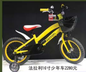
法拉利16寸少年车2280元