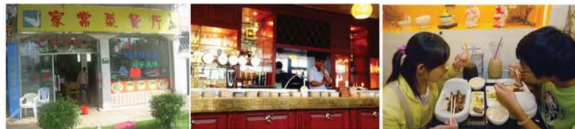
▲下馆子之普青VS文青VS二青

↑“普青”关键词：实惠 “经济实惠、美味可口”是普通青年们下馆子时的选择标准，那些盘子大、菜量足的“××家常菜”、“××快餐店”是他们经常光顾的就餐场所。来一碟老醋花生，再拌个黄瓜，炒两样热菜，几扎啤酒下肚，便是人生一大乐事。