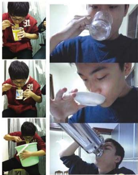
左图：吃泡面之普青VS文青VS二青 右图：喝水之普青VS文青VS二青

→“普青”关键词：规范 普通青年通常吃有吃相，喝有喝样，无论是拿筷子的动作还是端水杯的姿势都如出一辙，像是一个流水线上的产物。从他们身上，你可以看到家长和幼稚园老师们手把手孜孜不倦教导的优良成果。