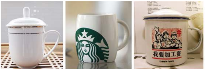
▲犯二餐具 ▼犯二杯具

↑“普青”关键词：实用 和生活中其他方面一样，普通青年们对餐具要求不高，满足基本需求即可。无论是锈钢盘子、一次性筷子还是粗瓷大碗，反正接到杯里就是水，拣到碗里都是菜。