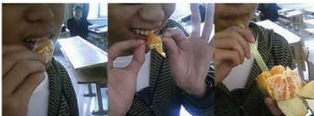
▼吃橘子之普青VS文青VS二青

→“二青”关键词：夸张 仿佛犯二青年吃饭就是为了找乐子，他们丝毫不顾及自身形象，吃相热烈而奔放，总能于出其不意中引爆笑点。他们可以给橘子插上吸管，把玉米啃得像多米诺骨牌。如果你指责“二青”们吃相太烂，他会理直气壮地反驳你：吃了二三十年饭了，就不兴人家改改规矩嘛！