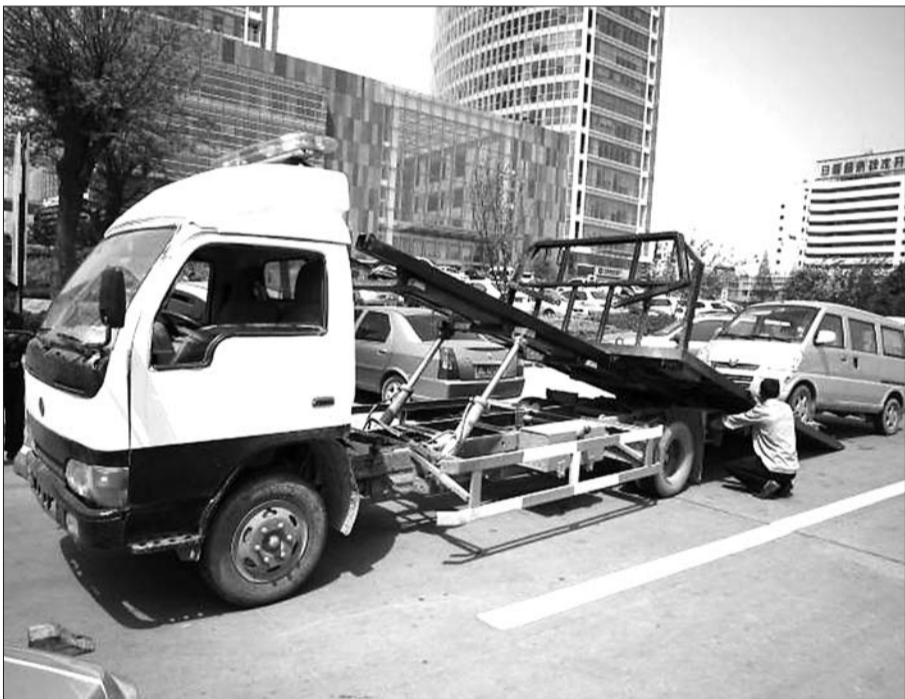
5 月 2 日,一违规停放的车辆被清障车拖走。