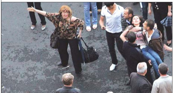
▲4日,一名女子在气球发生爆炸时受伤。

炸并起火,致使140多人受伤。按亚美尼亚紧急情况部的说法,104人入院接受治疗。气球爆炸可能由某个吸烟者在气球附近点烟引发。目前尚不清楚气球中填充气体的成分。警方称气球中可能混入了可燃物。