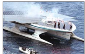
船员挥动焰火棒以示庆祝。

据新华社巴黎5月5日电 据报道,被制造商称为全球最大太阳能动力船的“星球太阳”号4日抵达摩纳哥,历时一年半多完成了6万公里航程,结束了其首次环球之旅。“星球太阳”号船体由碳纤维材料制造,船身上部铺有总面积达537平方米的太阳能光伏板,在充满电的状态下,该船一次最远可航行300公里。“星球太阳”号从开始研制到完成此次环球之旅前后历时8年,共耗资1500万欧元。