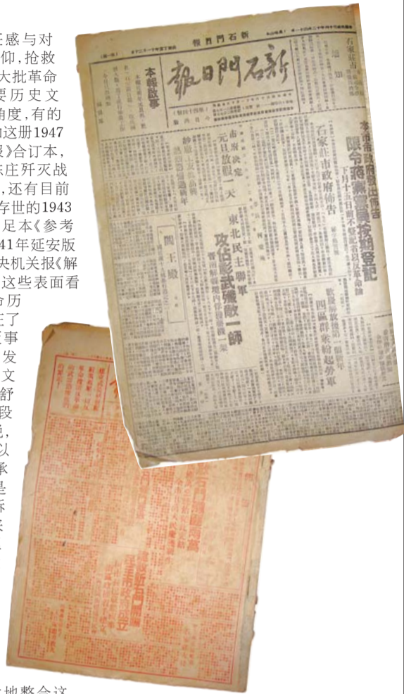
编辑：张向阳 美编：牛长婧 组版：五军

一种历史责任感与对革命前辈的敬仰，抢救式地搜集了一大批革命战争年代重要历史文献，从版本学角度，有的已是孤品。比如这册1947年《新石门日报》合订本，比如1939年陈庄歼灭战《抗敌报》号外，还有目前国内唯一发现存世的1943年延安版连月足本《参考消息》，以及1941年延安版整套的中共中央机关报《解放日报》等等。这些表面看似粗糙的革命历史文献，却见证了我党新闻出版事业由小到大的发展历程。对于文化遗产，作家舒乙先生有过一段精辟论述，他说，文化遗产之所以要延续它，传承它，弘扬它，是因为它能告诉你从哪里来的，要到哪里去。其实解放区出版的报纸，作为革命文化的精髓与宝贵财富，同样阐述了这样一个道理。如何行之有效地整合这些民间资源，很好地开发利用，使之成为爱党、爱国主义教育的好教材，才是这些散落民间的革命历史文献最大的意义之所在。