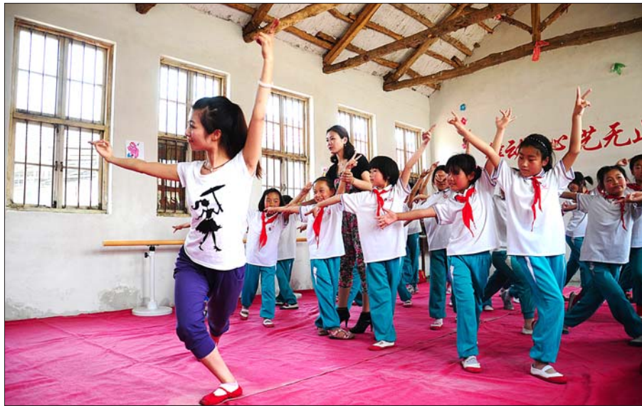
小朋友们跟着日照市舞蹈家协会的舞蹈家学习舞蹈《上学路上》。

日照市舞蹈家协会主席苏立新介绍,协会之前在日照实验二小、南湖镇幼儿园、望海社区开展了送舞蹈艺术进校园、进社区合作教学试点,取得了非常好的效果。今年协会将进一步扩大