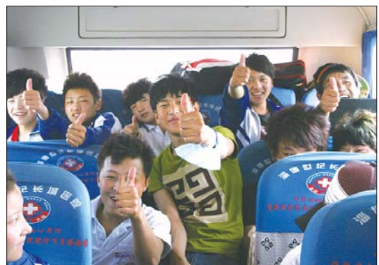
▲在去车站的车上,玉树的学生打着手势说:淄博真棒。