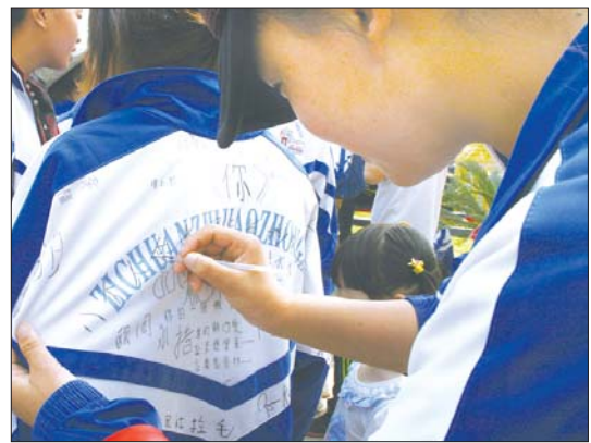
▲学生们在校服上写下祝福的话语。

年零7个月的学习、生活,已经圆满完成了所有的理论课程,即将走上实习岗位,老师们也将带着新学的专业知识和技能返回工作岗位。为了表达对淄博人民的感激之情,在他们即将离开之时,玉树职业技术学校向淄川职教中心以赠送纪念石的形式,纪念两地师生的深厚友情。