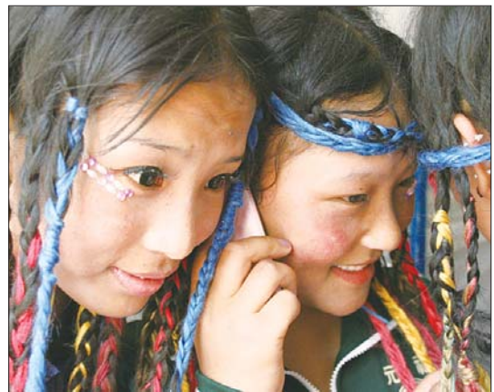
▲忠尔才仲和妈妈通电话,告诉妈妈什么时候到家。