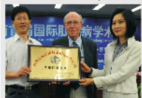
济南肛肠医院成为山东一家肛肠国际合作医院