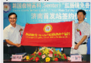
韩国森特集团成为济南肛肠医院又一家战略合作伙伴

(Senter)集团成为济南肛肠医院又一家世界级战略合作伙伴。森特医疗集团最新研发的韩国进口腹腔镜落户济南肛肠医院,成为济南肛肠医院与森特集团强强联合后的第一合作项目,为我市肛肠患者的快速确诊提供了世界级检查手段!