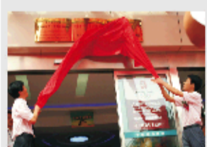
济南肛肠医院成为北京中日友好医院安氏疗法济南分中心