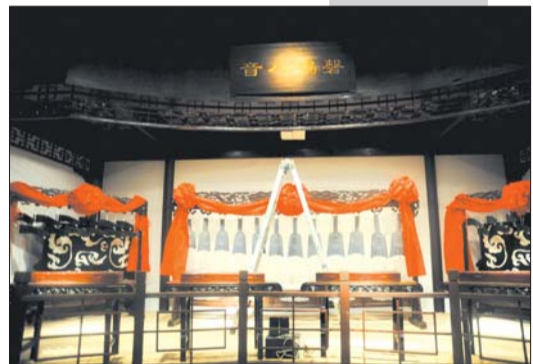
观赏石馆内的馨鸣八音。本报记者 李泊静 摄