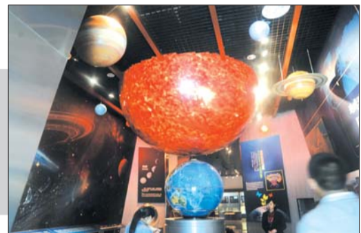
地球厅内太阳系的微缩场景。