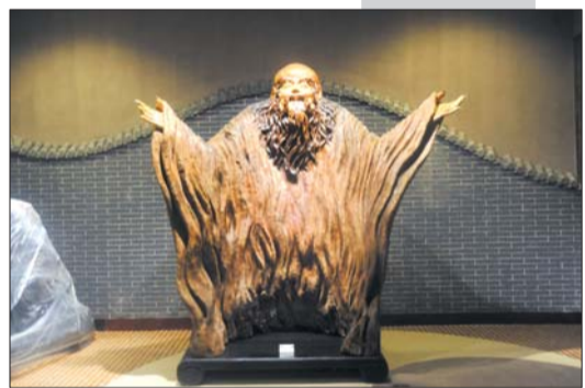
根雕艺术馆内香樟木材质的老子雕像。

走进生物厅,更像进入一个动物世界。厅内有感应设备,站在10种鸟的图像前,就可以听到这种鸟发出的鸣叫声。