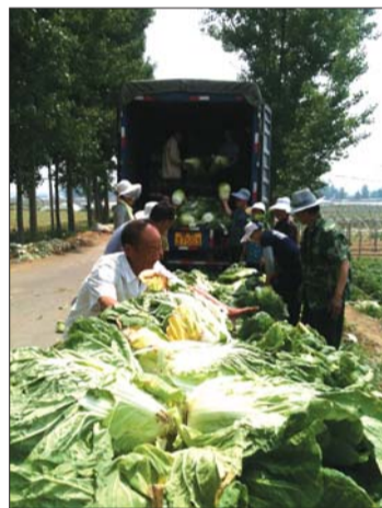
外地商贩来泰安“抢购”白菜。

市物价局工作人员介绍,如果批发价太高,零售商势必也要涨价,白菜不同于其他蔬菜,价格过高市民不会接受。