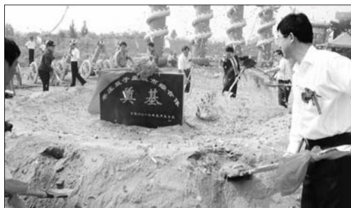
新城双子座城市综合体项目奠基。