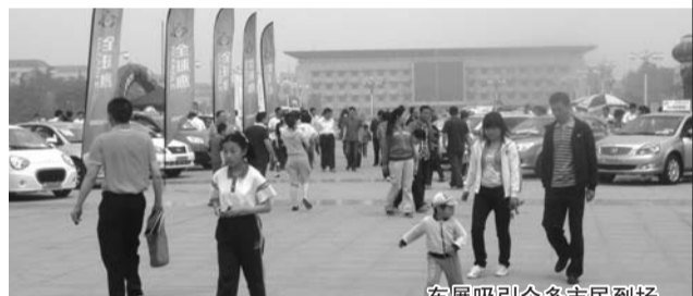
车展吸引众多市民到场。

现出强烈的兴趣,相信肥城和新泰的消费者可在车展上见到这些品牌4S店的身影。此外,济南骐骥英菲尼迪4S店已确定参加新泰巡展,新泰地区一直对豪车品牌保持较高购买力,本报新泰巡展也许将成为高档车的新战场。