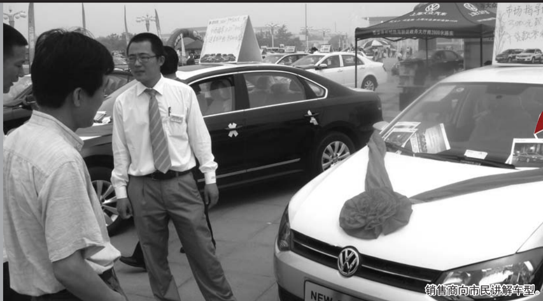
销售商向市民讲解车型。