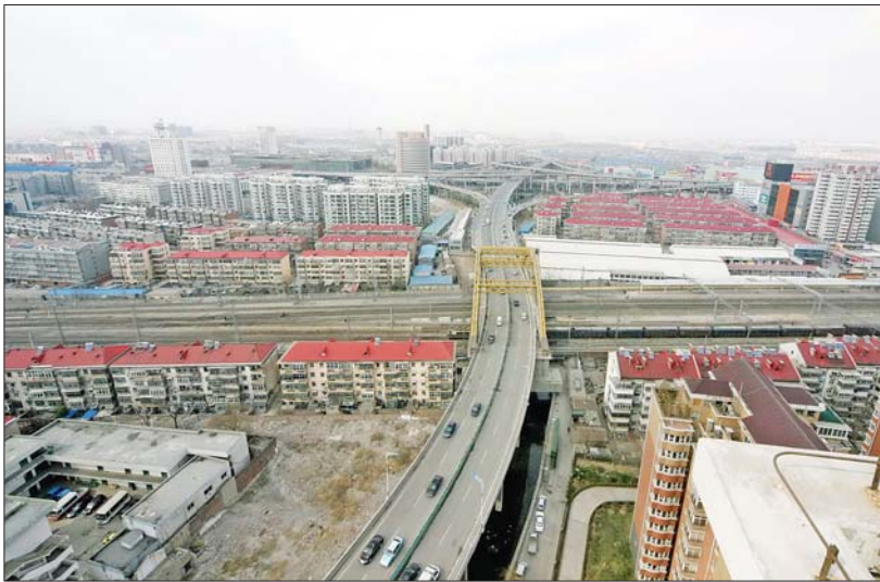
顺河高架路这条南北要道目前还没有打通(资料片)。

济南市城区内河道共63条，近几年，基本完成治理17条。如今，护城河清泉汇成，成果来之不易。杨鲁豫要求，要杜绝污水通过河