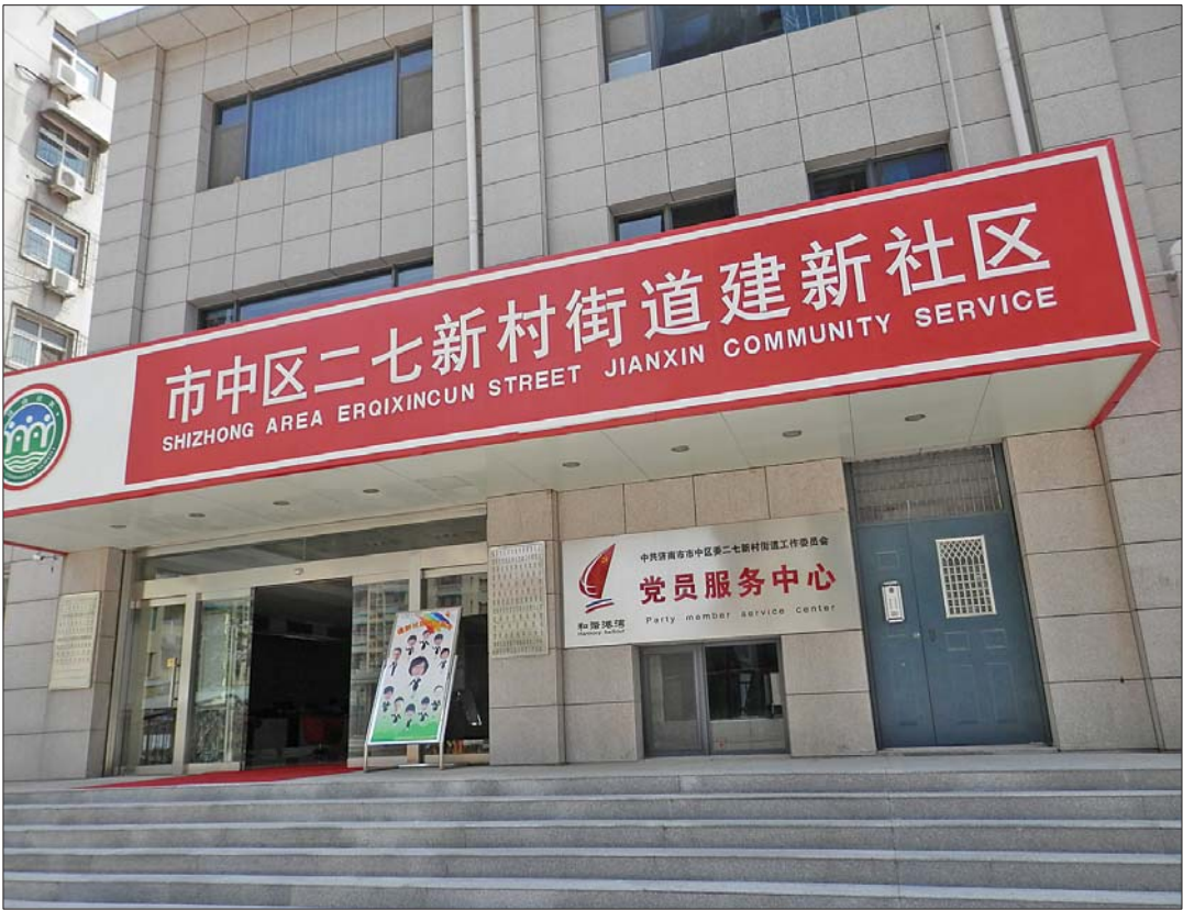
近几年部分社区居委会的办公条件得到了很大改善。见习记者 修从涛 摄