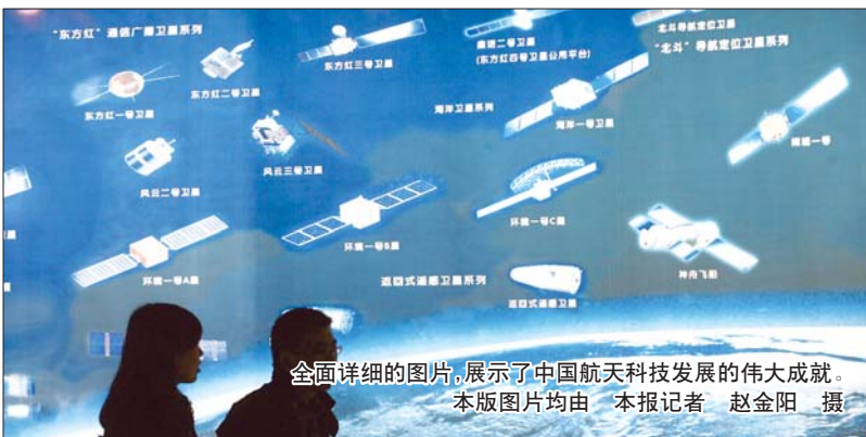
全面详细的图片,展示了中国航天科技发展的伟大成就。