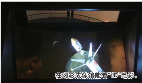
在幻影成像馆能看“3D”电影。