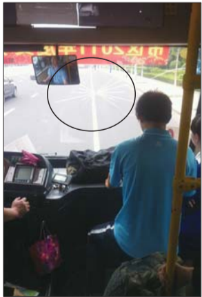
61路车挡风玻璃右侧出现裂纹。