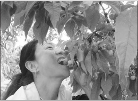
一位游客试着去咬树上的樱桃。