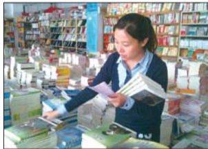
▲本报记者为孩子们选购图书。

打包时也特别小心,有的甚至用两层厚厚的打包纸包起来,“农村孩子看本书不容易,如果有了什么破损,我都觉得对不起他们”。