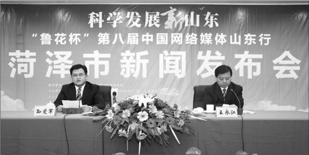
▲菏泽新闻发布会现场。

菏泽境内探测煤炭储量281亿吨,已探明石油储量5625万吨、天然气储量273立方米……菏泽是一座拥有巨大开发潜力的信息的资源和能源城市,同时还是充满魅力的生态宜居城市,充满活力的希望之城。 菏泽目前已经初步形成了新能源、新材料、新医药等10大特色明显的产业集群,培育出了新巨龙能源、东明石化、玉皇化工、步长制药、山东达驰等一批知名企业,极大地增强了菏泽发展后劲。