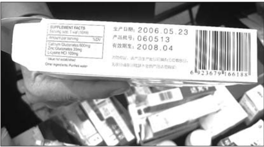
假药生产日期等虽印刷清晰,但生产日期与药盒一起印刷,而非采用钢印、喷墨式打印和激光喷码。

本报5月15日讯(见习记者 王超) 15日上午,日照市公安局在东港区政府广场开展经侦宣传日活动。日照警方还邀请了人民银行、银监、商务、工商、质检、食品药品监督管理局、知识产权等有关活动参与。 日照市食品药品监督管理局的展示桌上展出了很多劣质的药品,工作人员向市民宣传有关辨别真伪的相关知识。