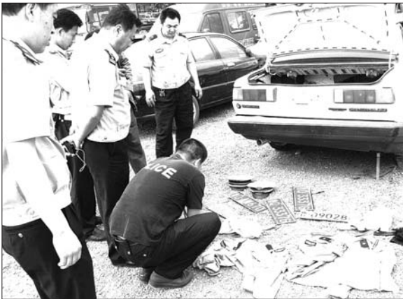
14日,民警查获的假警车上,发现了假车牌、假警服等警备用品。

止我们追击。”民警在躲过嫌疑人几次抛出的铁蒺藜后继续追击。 当追击到日兰高速66KM处时,嫌疑车辆发现在前方已有交警设卡堵截,便迅速调头逆行逃窜。在逃窜过程中执勤民警所驾驶的追击车辆直接撞到对方车辆右前门,车上人员弃车逃窜。 据当时正在路上巡逻的市交警高速公路大队莒县中队执勤民警说,他在接到电话后立即带领协勤员赶往日兰高速公路69公里处准备堵截,同时并拨打莒县公安局指挥中心电话要求夏庄派出所、长岭派出所前来增援。随后在得知嫌疑车辆已到达日兰高速公路51公里处,执勤民警马上拦截所有菏泽方向的车辆封闭高速。 凌晨3点10分左右,莒县中队的执勤民警看到在日兰高速公路68公里左右有一辆轿车开着大灯开始掉头逆行,随后听到“砰”的一声,发生了碰撞事故,执勤民警就赶紧往那边跑。