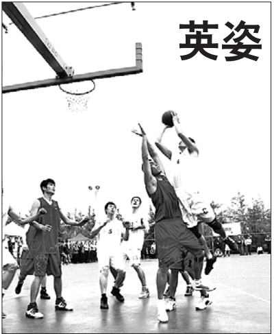
14日,2012年中国业余篮球公开赛日照赛区、山东省第四届“百县篮球”比赛日照赛区、日照市第二届全民健身运动会篮球比赛落下帷幕,来自日照市社会各界的24支代表队参与角逐。兴业集团篮球队夺得冠军

“我进去喊了一句‘有人吗’?但是没有人答应,我听见有人在厨房做饭,我就悄悄上了二楼,在二楼的一个包里找到一沓钱塞进裤腰里。但下楼的时候被主人发现了。”她说。 经进一步询问,犯罪嫌疑人刘某交代,这并不是她第一次用这个方法盗窃。 5月4日下午4点多,刘某在安东卫街道一个村里看见有个煎饼房,进去时有几个人在南平房干活,但他们都没看到刘某。 “我进了堂屋,从一个箱子里面偷了9500元钱,我出来开门的时候被一个人发现了,我就假装问这是不是卖煎饼的地方,然后我就买了四块钱的煎饼,那些人也没怀疑我,我就赶紧开车走了。”她说。 “我们在办案过程中,发现犯罪嫌疑人刘某只偷现金。即使有机会偷黄金等贵重物品时,她也坚决不偷黄金。后来我们经过了解,原来刘某对黄金有种恐慌,因为她以前曾经因为盗窃黄金而被抓过。”办案民警告诉记者。 据了解,犯罪嫌疑人刘某2004年因盗窃黄金被济南市槐荫区人民法院判处有期徒刑9个月,2008年因盗窃罪被东港区人民法院判处有期徒刑二年、缓刑三年。 因犯罪嫌疑人刘某怀有身孕,目前犯罪嫌疑人刘某已被监视居住,案件正在进一步调查中。