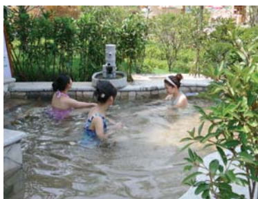
山东旅游的五年嬗变 ——详见B07版