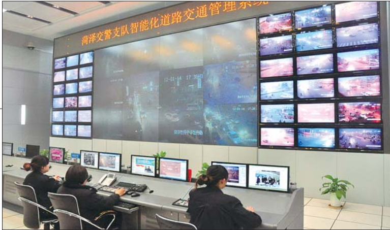
▲菏泽联通助力平安菏泽智能化交通管控信息系统建设。

频监控和信息比对，晚上11点在曹州路菏泽医专家属院发现嫌疑车辆并成功抓获犯罪嫌疑人。一年来，通过网上追逃人员自动比对系统公安部门已抓获网上逃犯192人，查控重点人员1560人，在全省交警系统网上追逃工作中名列前茅，形成了路面、车管、事故、违法处理等民警都能通过该系统抓获违法犯罪分子的局面。据了解，自2009年交警智能化管控系统运行以来，共为上级领导提供警务情报信息438次，为其他警种提供破案线索783起，节约办案经费500多万元，挽回各类经济损失近千万元。中央电视台、山东电视台、齐鲁电视台、大众日报、法制日报、齐鲁晚报和市级等多家新闻媒体曾多次给予报道，并得到了公安部交管局、山东省公安厅的高度赞扬。