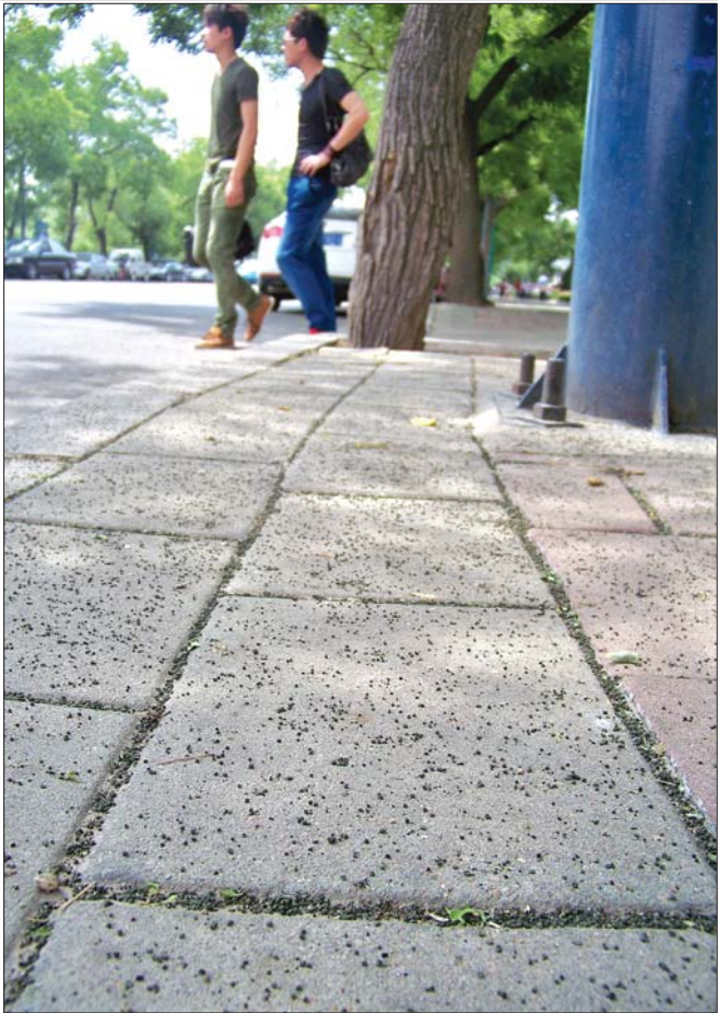
国槐树下一地虫子粪便。