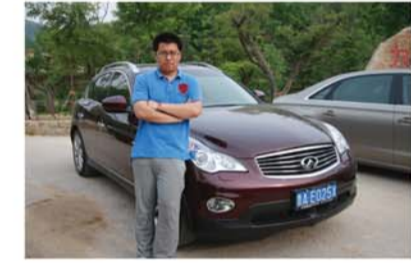
英菲尼迪EX25——跨界绅士 试驾车型:英菲尼迪EX25 市场售价:49.80万-53万 车型尺寸:4638/1803/1598(mm)

CTS拥有所有狂热运动派想要的一切元素:有棱有角的家族式脸孔完全可以让初识它的人心潮澎湃,前卫锋利的整车线条打造出一辆“刀锋战士”般的梦幻座驾,就连内饰造型也很好地体现了硬朗刚强的设计风格。18