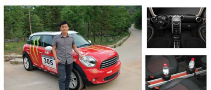
MINI COUNTRYMAN——越野精灵 试驾车型:MINI COUNTRYMAN 市场售价:28.80万-41.50万 尺寸:4097/1789/1561(mm)

编辑点评: 4门4座,4轮驱动,4米车长,一款时尚个性、乐趣无穷的跨界多用途小车。