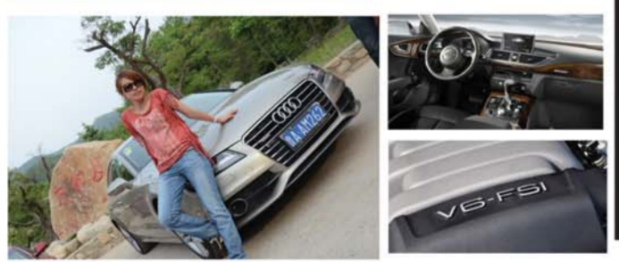
奥迪A7 Sportback——C级轿跑新贵 试驾车型:奥迪A7 3.0T 自动舒适型 市场售价:72.8万-95.8万 车型尺寸:4969/1420/2914(mm)

当A7行驶在通往九如山的公路上时,路边斑驳的树影掩映在车身上,光线透过全景天窗照进车里,这感觉像是行驶在一副水墨山水画中。A7装备的3.0 TFSI V6 机械增压发动机是目前奥迪旗下的明星发动机,最大功率220千瓦,最大扭矩440N·m,百公里加速仅为5.6秒。机械增压最大的优势就是对动力的压榨没有任何迟滞的现象,非常线性的输出和7速S-Tronic双离合变速器的搭配也是恰到好处。初段加速就可以感受到涡轮增压同样出色,较长的轴距让腿部空间相当宽敞,就算车高仅有1.42米,可头顶上方也没有任何压迫感。