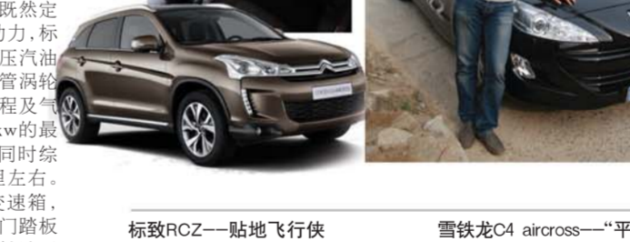
雪铁龙C4 Aircross——“平民”明星 试驾车型:雪铁龙C4 Aircross 市场售价:21.98万-27.98万元 车型尺寸:4340/1800/1635(mm)

是三菱的2.0升自然吸气发动机,最大功率以及最大扭矩分别达到了112kw和198Nm,匹配模拟6速CVT变速箱获得平顺舒适的加速体验,并且CVT变速箱的低油耗也已经毋庸置疑。 雪铁龙C4 AIRCROSS的引进让我们在20-30万元区间的SUV中又多了一个选择,时尚前卫的外观,丰富的电子配置,宽大明亮的全景天窗,足够的车内空间以及浪漫的气质定然会成为你选择它的理由。