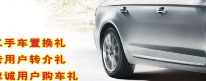
雪铁龙C4 Aircross——“平民”明星 试驾车型:雪铁龙C4 Aircross 市场售价:21.98万-27.98万元 车型尺寸:4340/1800/1635(mm)

C4 AIRCROSS外观观设计感极强,继承了传统的雪铁龙前脸,配以动感激扬的腰线,营造出时尚的外观,内饰风格与ASX劲旅较相似但是细节做工非常出色,硕大的全景天窗会让你怦然心动,配以LED的带状氛围灯,在夜间开启时立刻会营造出标准的法式浪漫。动力方面这款采用的是