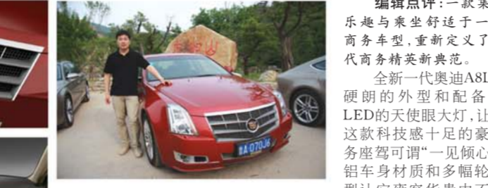
凯迪拉克CTS——奔放的激情 试驾车型:凯迪拉克CTS 市场售价:44.8万-110万 车型尺寸:4860/1842/1475mm