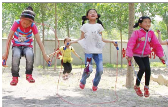
拿到安利志愿者捐赠的体育器材,孩子们课间玩起跳绳来。