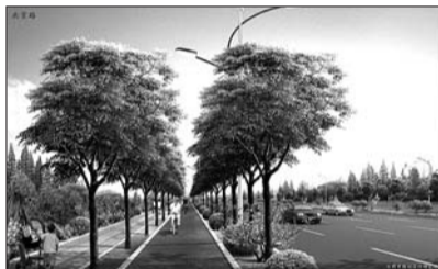
北京路绿道效果图。