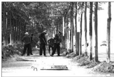
17日下午,北京路,工作人员在进行绿道建设前期的清理工作。

据了解,市域绿道和城市绿道将配置综合服务驿站和一般服务驿站,社区绿道配置服务点。驿站外观形体与周围环境协调统一,功能包括站内自行车租赁点、信息咨询、无障碍设施、照明、通讯、治安、环卫等。