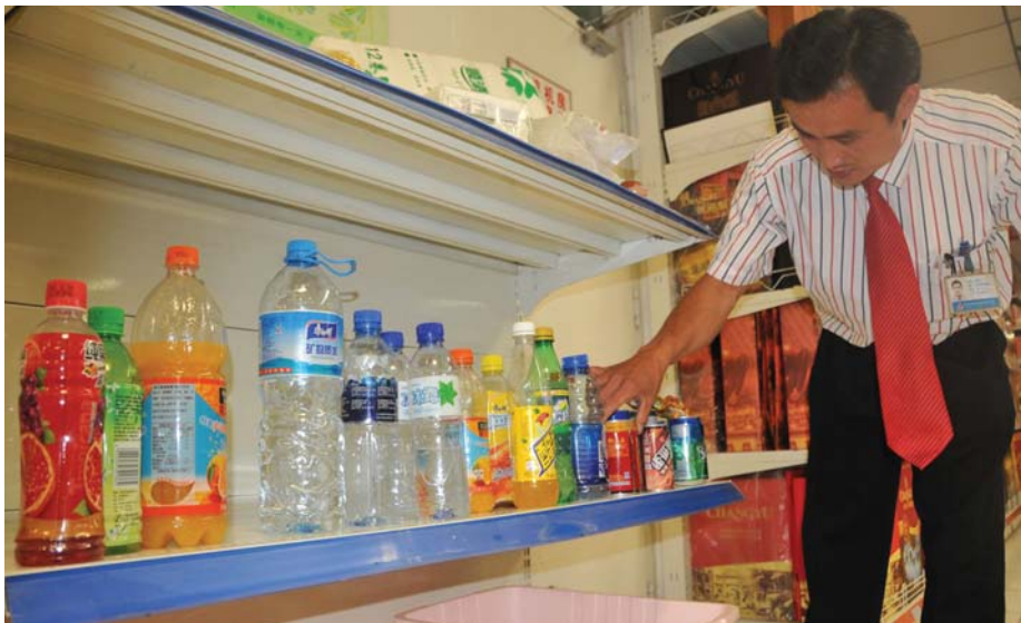
某超市工作人员清理出的损耗饮料。

本报泰安5月17日讯(记者 孙静波) 17日,一市民在超市买了一瓶饮料,准备喝时发现瓶盖已经被拧开。记者采访发现,部分市民吃喝后不结账,让超市饮料和散装食品损耗严重。